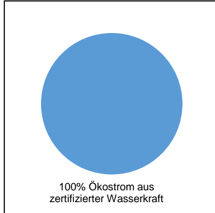
Stromlieferungen der Gemeindewerke Schönkirchen GmbH